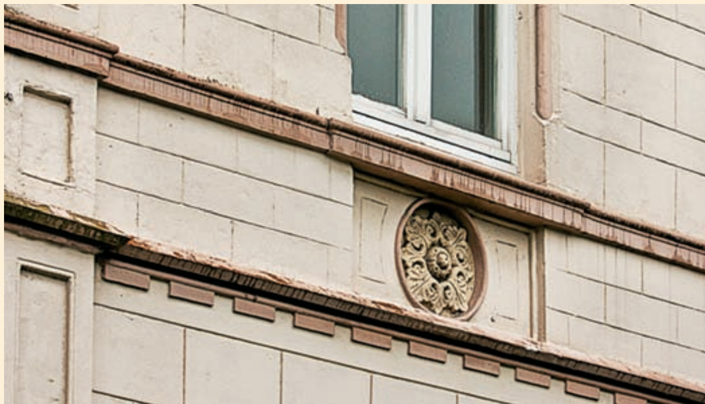
Lemgo, Bismarckstraße Historische, denkmalgeschützte Stuck- und Putzfassade vor der Instandsetzung.

Sind diese Schritte geklärt, beginnen die Altbauspezialisten mit ihrem Handwerk. Etwas Besseres kann einem Baudenkmal nicht passieren.