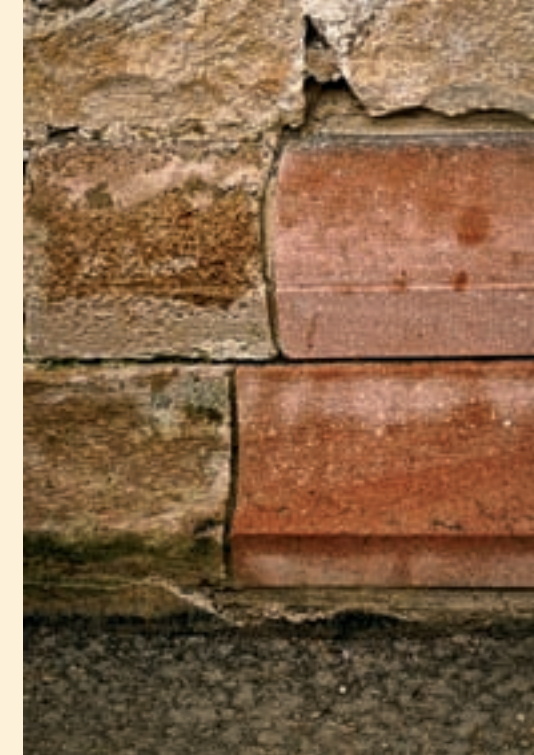
Ergänzung, Erneuerung eines Sockelprofils mit neuem, authentischen Sandstein nach historischem Befund und Dokumentation.

Unterfangungen Ankervernadelungen Mauerwerksspannanker, Zuganker Gewölbearbeiten Rissverpressungen Injektionen für Naturstein und Ziegelmauerwerk Sanierung und Instandsetzung Restaurierung Um- und Anbauten Innen- und Außenputz Stuckarbeiten Naturstein- und Ziegelsteinarbeiten Fassadeninstandsetzung und -reinigung Bautenschutz, Abdichtungen Betonanierungen (S.I.V.V-Zertifikat)