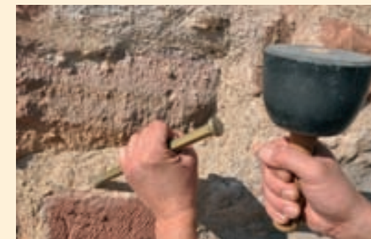
Handwerkliche Steinmetzbearbeitung am Fugenwerk und Scharrierungen der Sandsteinoberflächen.