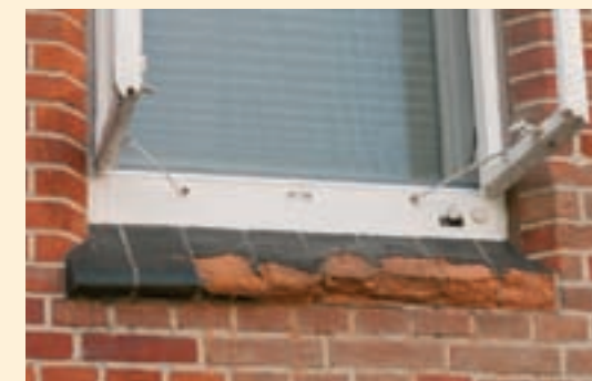
Historische, glasierte Ziegelsteine teilweise restauriert, instandgesetzt und durch neue, brandglasierte Ziegel ersetzt.