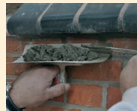
Ergänzungen und teilweise Erneuerungen der historischen Verfugung an der Ziegelfassade.