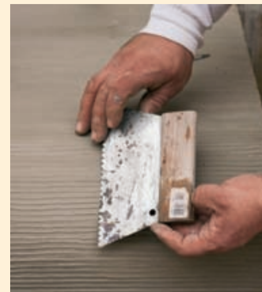
Rekonstruktion eines Kammzugputzes nach historischem Bestand und Vorbild.