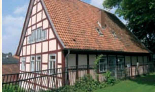
Altes Küsterhaus, Bad Salzflun Lehmausfachung mit einem Kalkputz

Lehm erfüllt alle Anforderungen ökologischen Bauens. Er ist ganz und gar ein Naturprodukt. Schon seit frühesten Zeiten setzen die Menschen auf Lehm als Baustoff. Keine andere Bausubstanz ist so lange erprobt, so widerstandsfähig wie Lehm. Seine ökonomische Bilanz ist auch nicht zu verachten. Da er an vielen Orten in Deutschland abgebaut wird, entfallen lange Transportwege. Ressourcen werden geschont und der Energieaufwand für die Herstellung von Lehmabbaustoffen ist sehr gering. Dieser uralte Rohstoff wird ohne chemische Prozesse zu einem robusten Baustoff, der hochwertig und vor allem gesundheitsverträglich ist. Lehm ermöglicht ein natürliches Wohnen. Er garantiert ein gesundes Raumklima mit einer relativen Luftfeuchte von 45 bis 55%. Große Mengen an Wasserdampf schluckt er einfach und gibt diesen bei trockener Luft wieder ab. Außerdem ist er ein hervorragender Wärmespeicher. Lehmwände sind die modernen Klimaanlage der Urzeiten. Für Allergiker ist er der ideale Baustoff, da sich seine Oberfläche nicht statisch auflädt. Ein weiterer Pluspunkt von Lehm ist seine Entsorgung: Lehmabbaustoffe sind kompostierbar und wieder recyclebar. Wer ökologisch, ökonomisch und gesundheitsbewusst Bauen will, für den ist Lehm der ideale Baustoff. Seine vielen positiven Eigenschaften gegenüber anderen Materialien machen ihn zum bevorzugten Stoff bei vielen Bauherren.