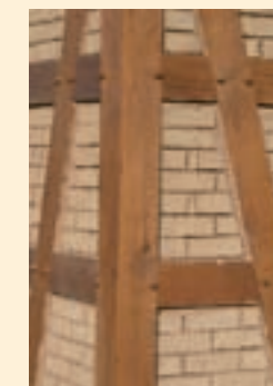
Fachwerkausfachung aus Leichtlehmstein, Rohdichte 1200 kg/m 3