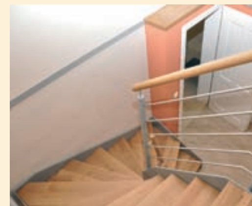
Treppenhausgestaltung mit Lehmfeinputz