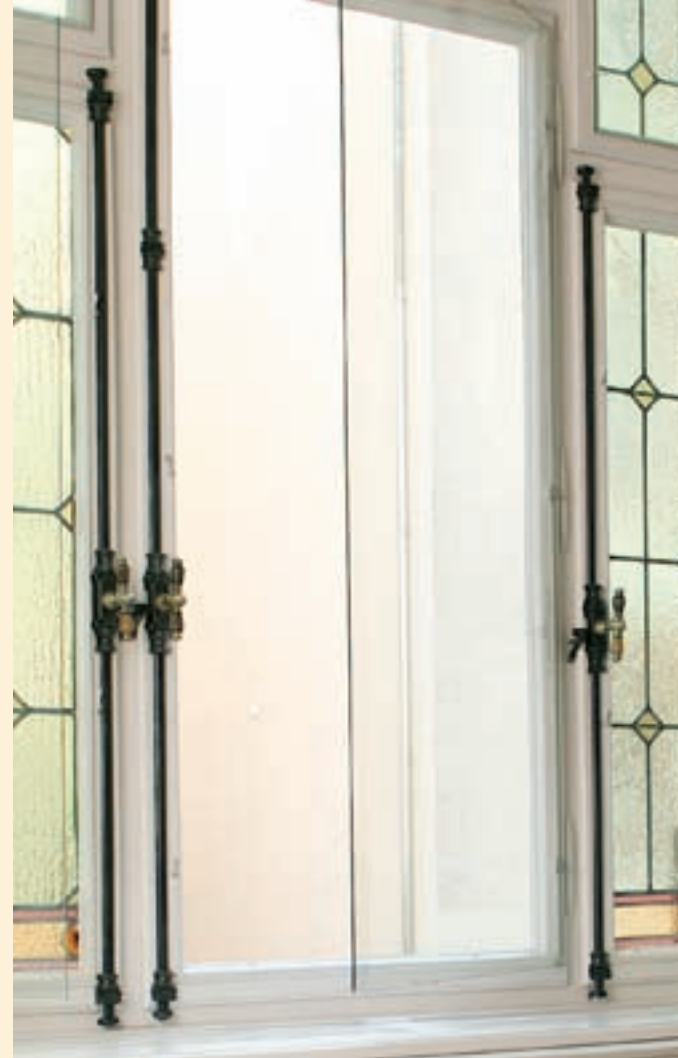
Ansicht einer komplett montierten Vorsatzscheibe (geöffnet).