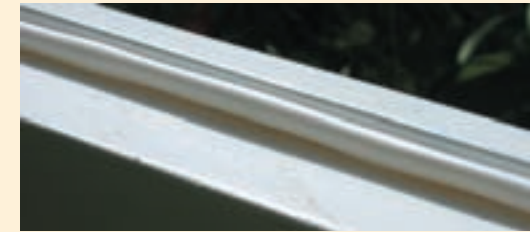
Zusätzliche Siliconzugluftdichtung in den Blendrahmen eingefräst und eingezogen.