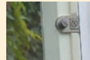
Ganzglasscheiben-Drehscharnier in Edelstahl gebürstet mit D-Profilabdichtung.