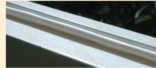
Zusätzliche Siliconzugluftdichtung in den Blendrahmen eingefräst und eingezogen.