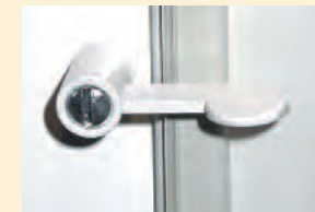
Halbvorreiber als Verschlussmöglichkeit.