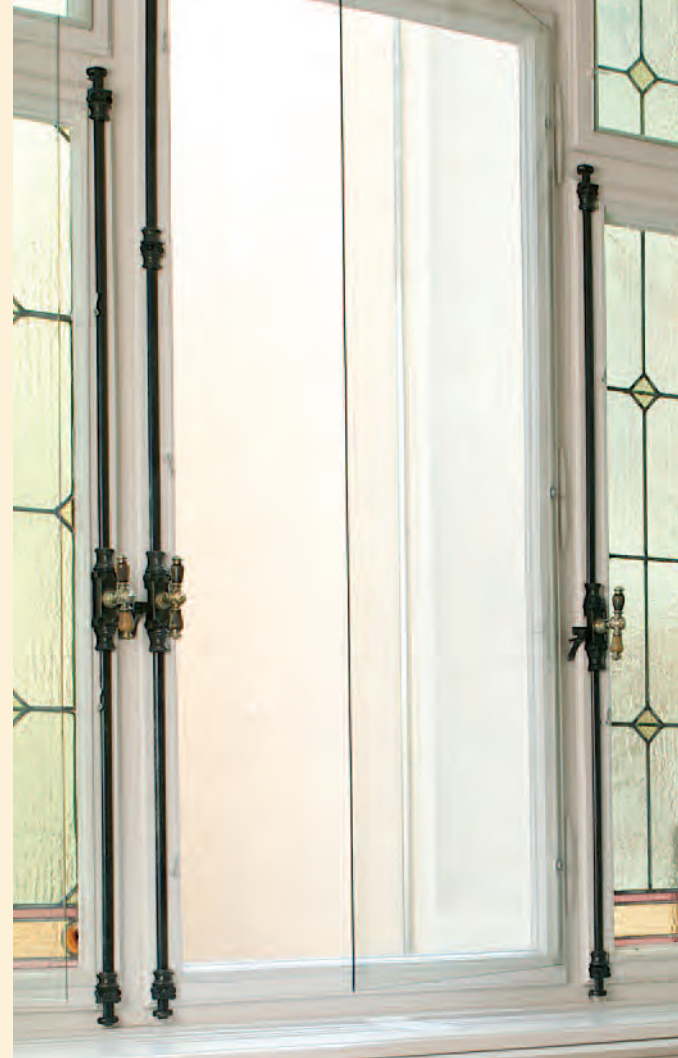
Ansicht einer komplett montierten Vorsatzscheibe (geöffnet).