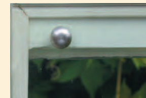
Hutverschraubung als Verschluss in Edelstahl mit D-Profilichtung.